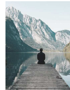
PRIVATE FAMILY SERVICES